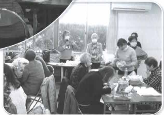
勝浦市ボランティアセンター事業による災害ボランティア講座。講師は、勝浦市赤十字奉仕団